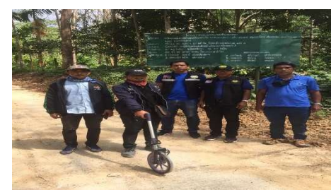
โครงการก่อสร้างถนน คสล.สายคลองใหญ่ - บ้านห้วยช่อง หมู่ที่ 8