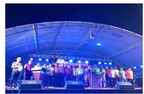
ลอยกระทงประจำปี 2564