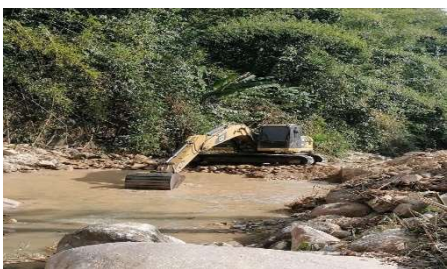
ขุดลอกคลองห้วยหมื่นสี่