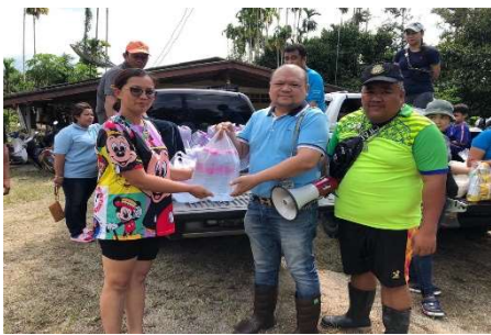
ช่วยเหลือผู้ประสบภัยน้ำท่วม