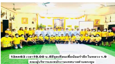
พิธีจุดเทียนเพื่อน้อมรำลึกในหลวง ร.9