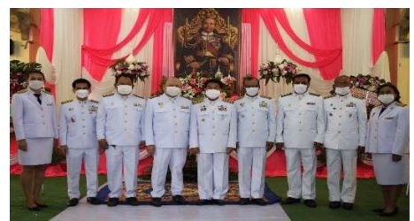
พิธีวางพวงมาลา 23 ตุลาคม 2563