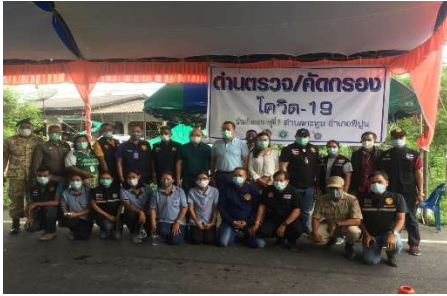
ด่านตรวจคัดกรองโควิด - 19